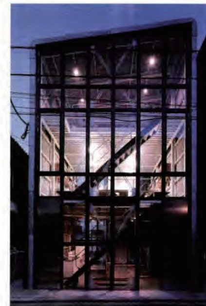
1999年に完成したLDKオフィス。現在もいくつもの時代を超えて原宿に生きている初代LGS。建築物が社会的な存在であることを強く認識させてくれる。

一方で、LGSシステムは、一般に販売されている“Cチャンネル”という、3.2mmの鉄材で加工していくシステムですから、かなり自由でフレキシブルなシステムです。いわば、街の鉄工所で製作ができる「プレファブ리케이션」システムなのです。「鉄」や「製品管理」の長所のみを抽出して、身近な建築に取り戻すための工夫が満ち溢れている、いわば、「ローテクの高品質」それがLGSシステムの本質なのです。